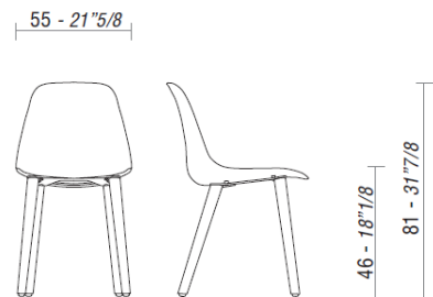
POLA, sedia con 4 gambe in legno.