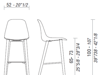
POLA, sgabello con 4 gambe in legno.