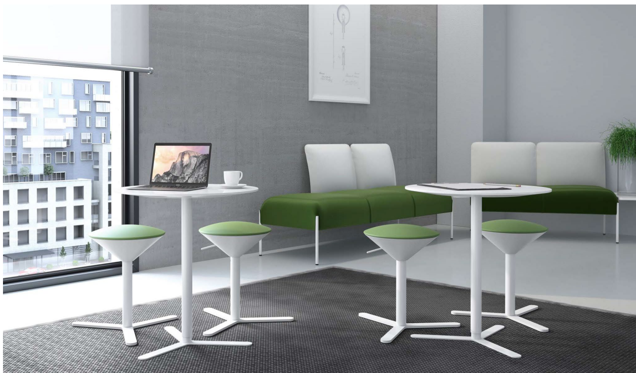
Cono tavolini con base verniciata Bianco Neve e piano in laminato Fenix Bianco..