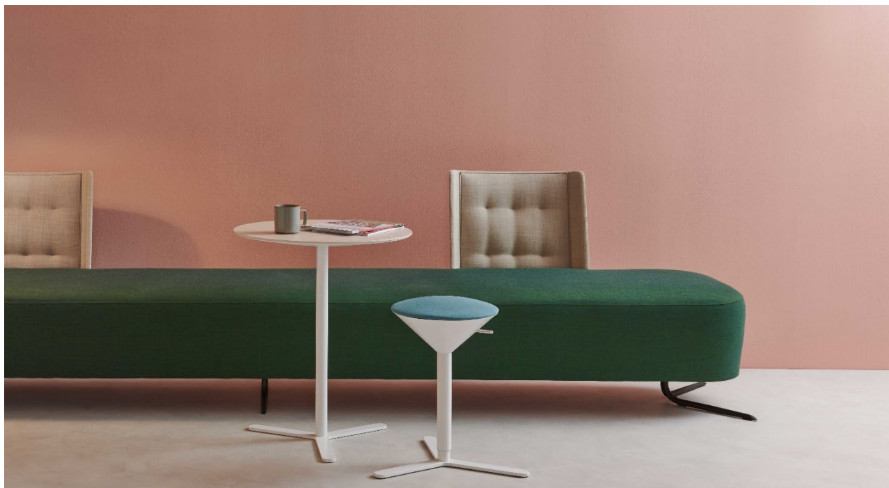
Cono tavolino con base verniciata Bianco Neve e piano in Ceramica.