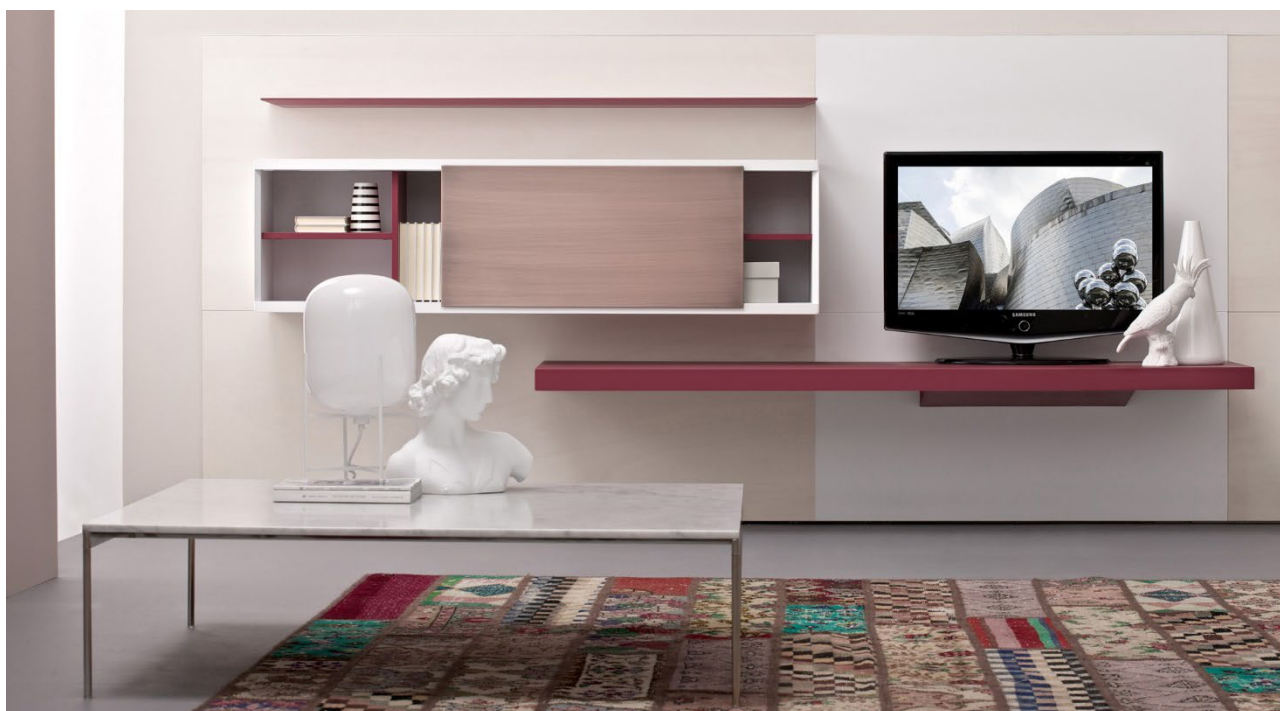
Darwin tavolino 120x120 con piano in Ceramica e struttura cromata.