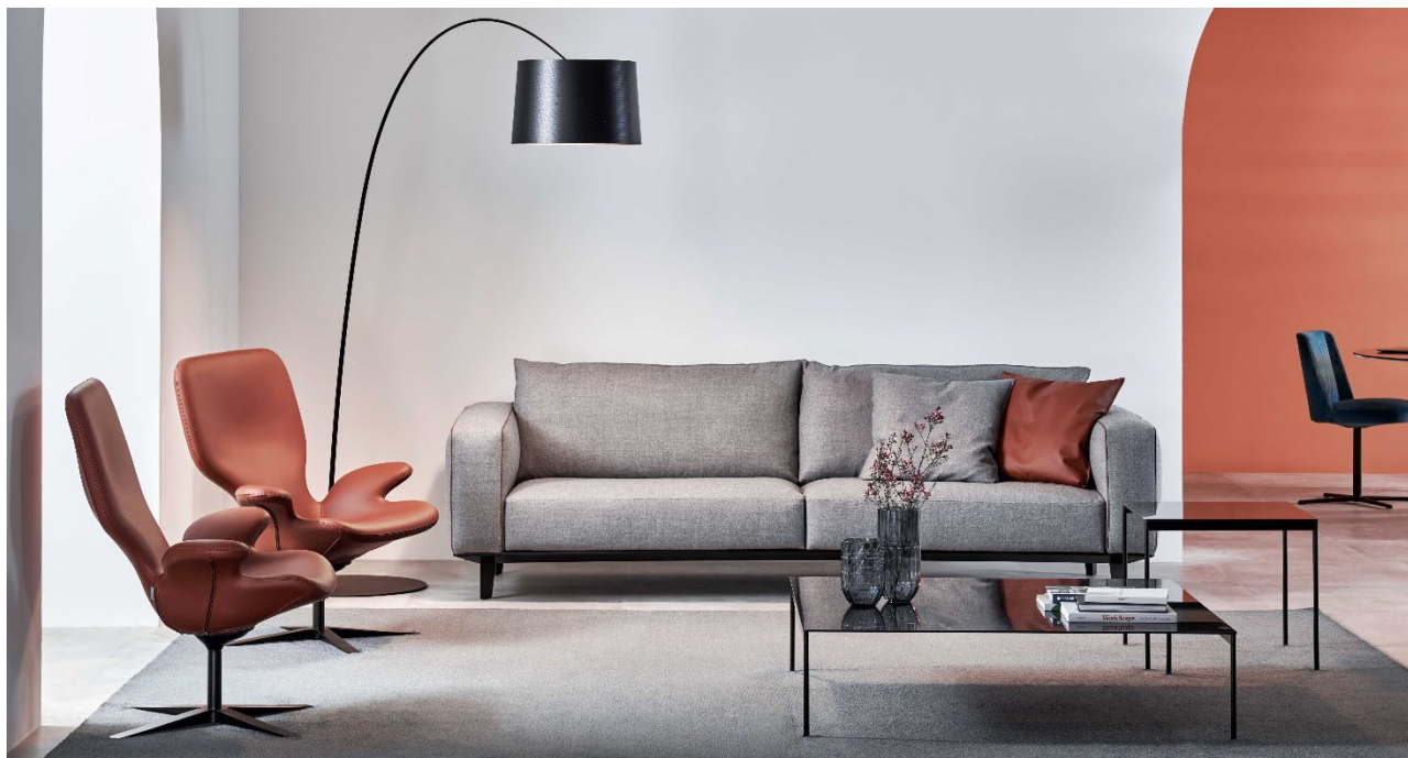
Darwin tavolino 55x55 e 120x120 con piano in Ceramica e struttura cromata.