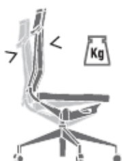
Regolazione tensione dello schienale - di serie