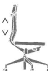
Regolazione del supporto lombare - di serie