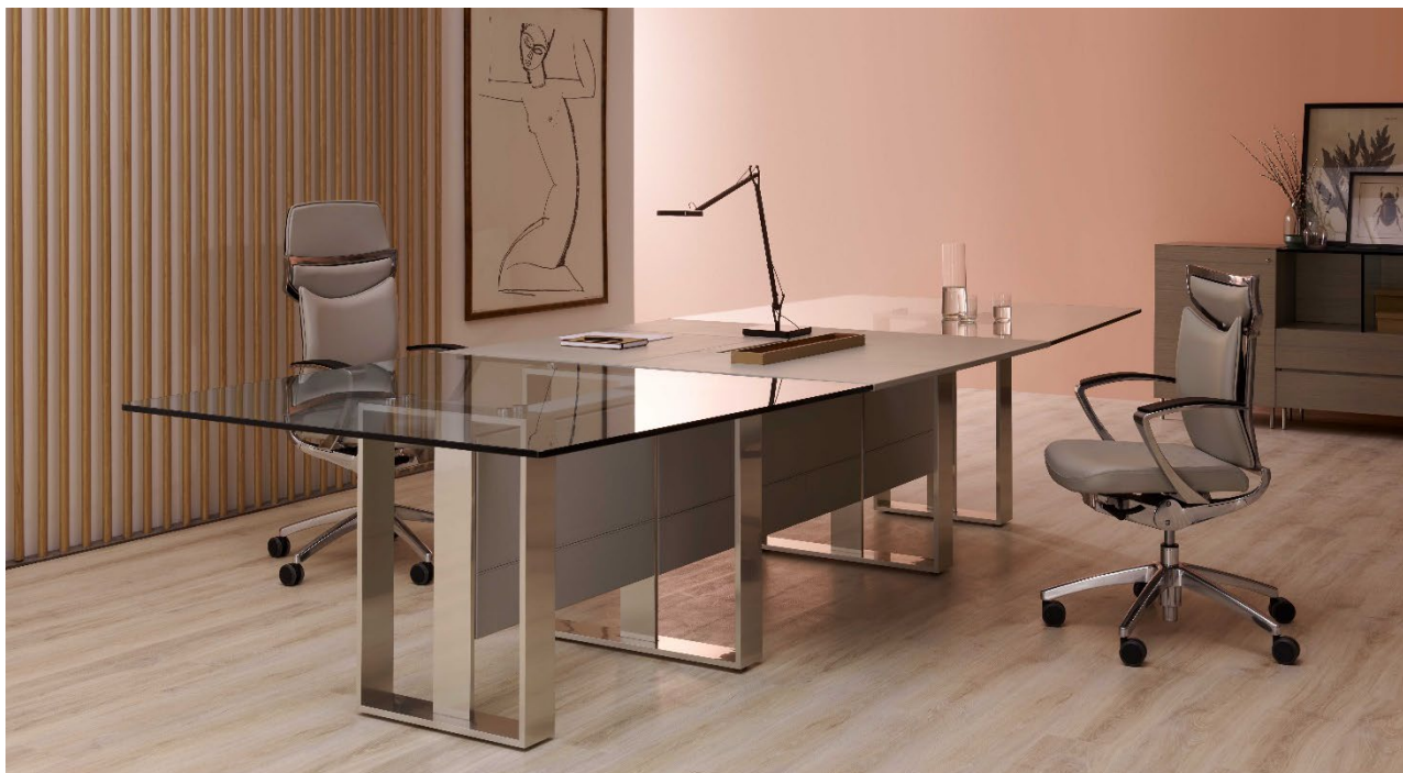
UniQa sedute con schienale imbottito rivestite in pelle.