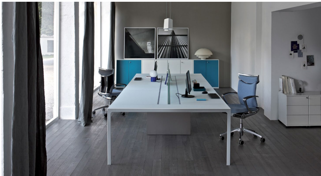
UniQa, seduta con schienale imbottito rivestito in tessuto.