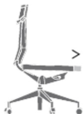
Regolazione sedile in profondità - di serie