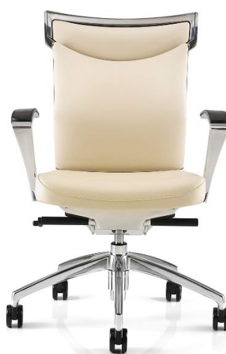
UniQa, seduta con schienale imbottito e poggiatesta, e UniQa con schienale imbottito.