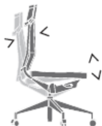
Meccanismo syncro - di serie