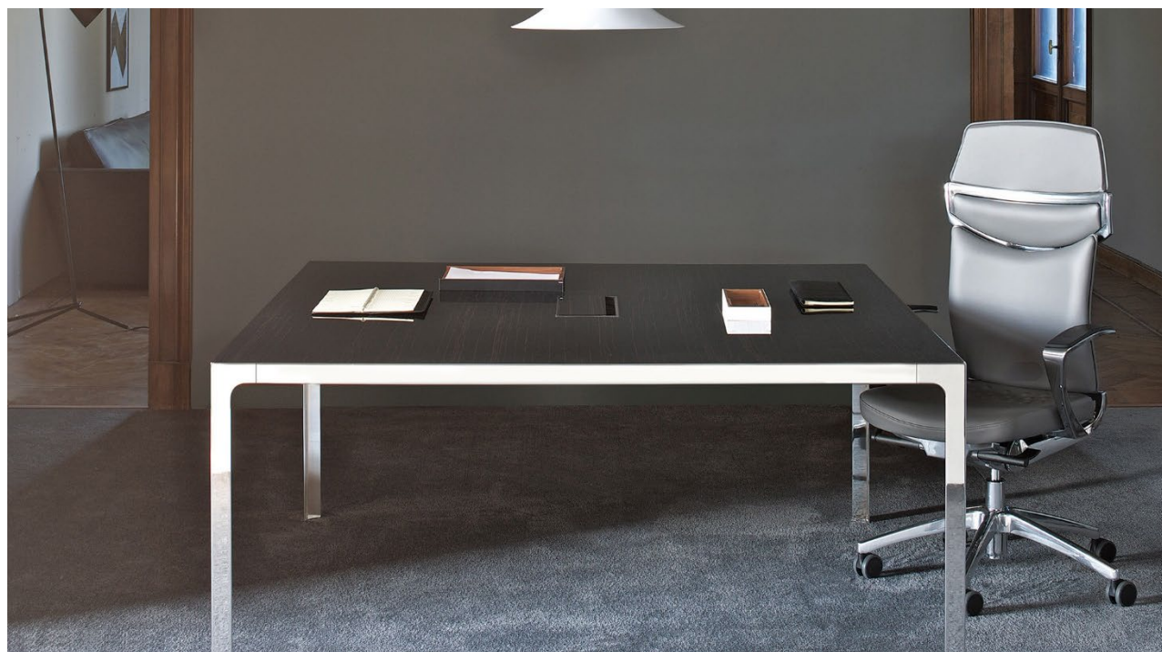
UniQa seduta con schienale imbottito e poggiatesta rivestita in pelle.