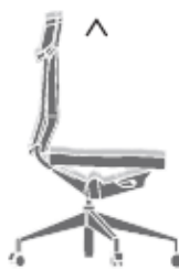
Regolazione in altezza - di serie