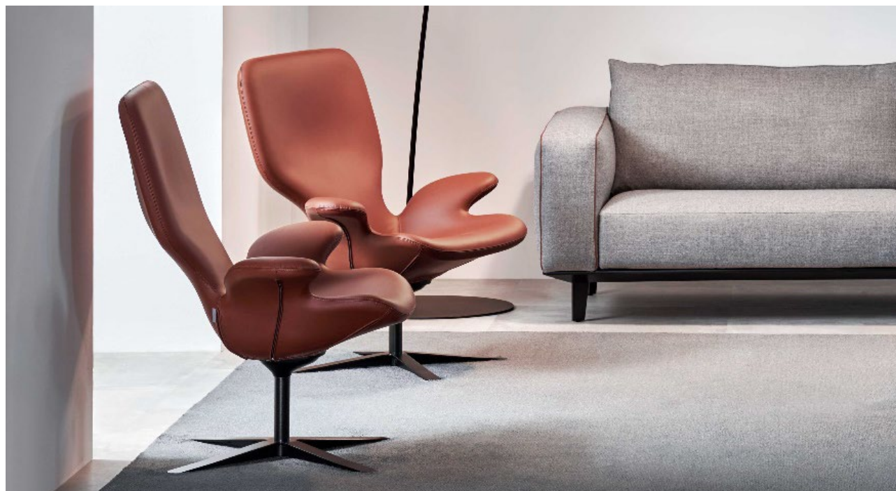
Clarke poltrona in pelle Soft.