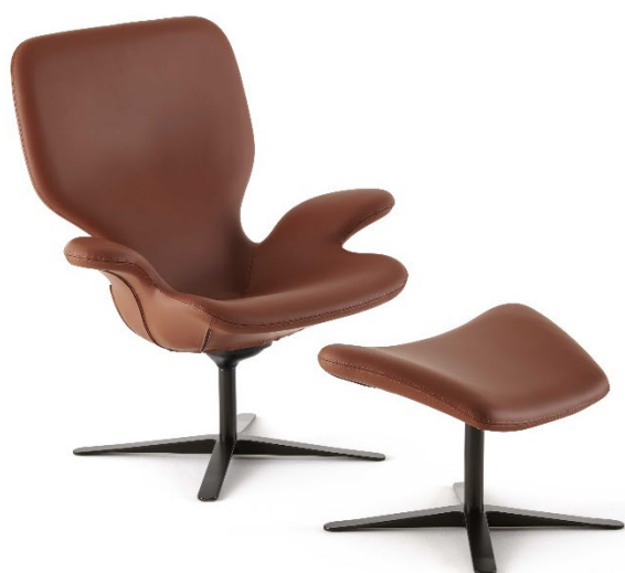
Clarke poltrona e pouf in pelle Soft.