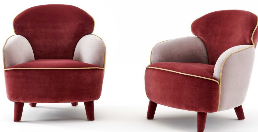
Polpetta poltrone in tessuto bicolore e bordino in contrasto.