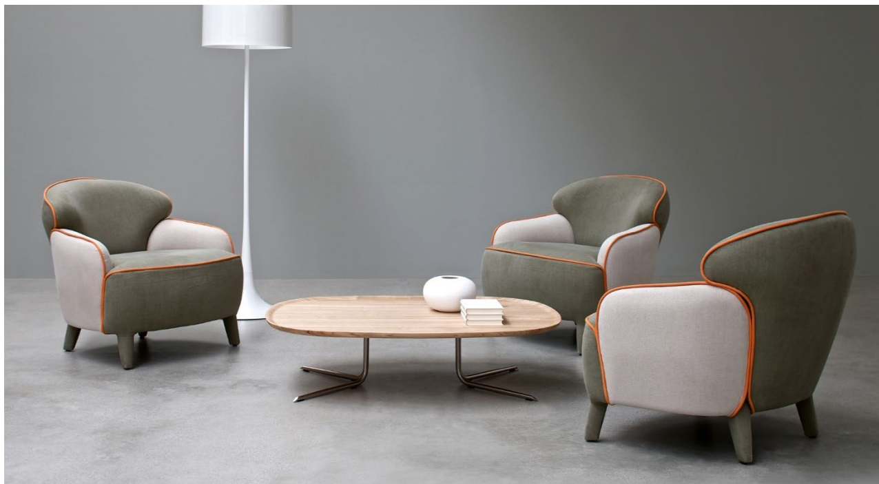
Polpetta poltrone in tessuto bicolore e bordino in contrasto.